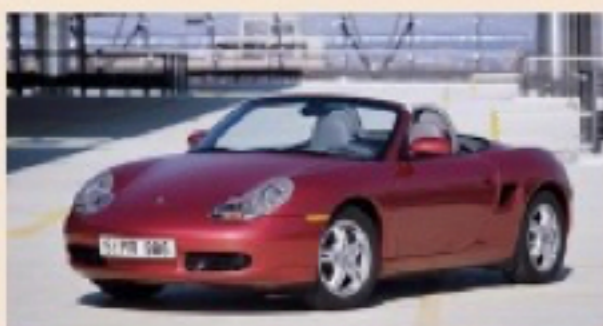
ANNIVERSARI | 14 settembre 2016 La Porsche Boxster comple vent'anni ed entra nel mirino del collezionisti

La diciannovesima edizione del Raid dell'Etna, Giro di Sicilia per auto storiche, kermesse che coinvolge ogni anno veicoli provenienti da tutto il mondo, si svolgerà dal 25 Settembre al primo Ottobre seguendo un itinerario di circa 1.000 chilometri attraverso luoghi e residenze nobiliari posti fuori dai classici itinerari turistici della Sicilia. Anche per questa edizione sono previste oltre cinquanta prove cronometrate, visite nei centri storici, prove speciali ma anche cene di gala, sempre ospitati dagli sponsor della Manifestazione, gli ormai storici Lufthansa e Porsche e, quest'anno per la prima volta, Ma.Fra: azienda leader in prodotti per la cura dell'auto.